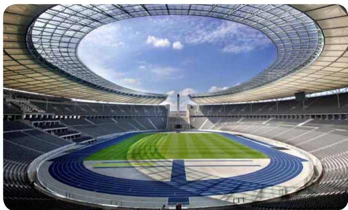
Blick aus der Ostkurve