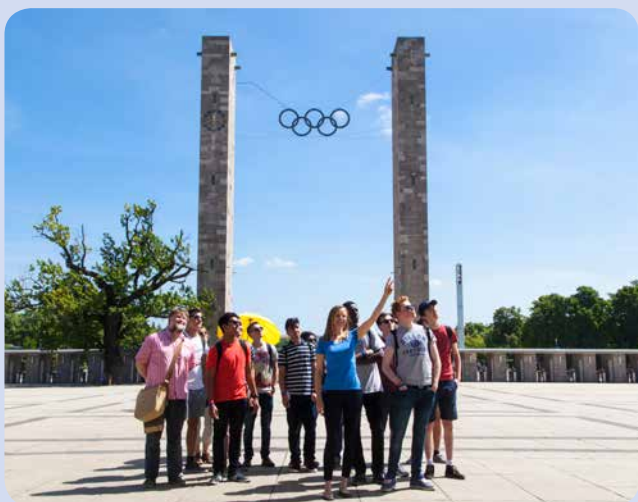
Sport und Geschichte, durch erfahrene Guides vermittelt

Antworten auf diese und noch viele weitere Fragen finden sportbegeisterte sowie geschichts- und architekturinteressierte Mittel- und Oberstufenschüler/-innen selbstständig während der neu im Programm aufgenommenen Entdeckungstouren durch das Olympiastadion Berlin. Die Angebote wurden teilweise mit gleichaltrigen Schülern/-innen entwickelt. Neben der Führung machen zusätzliche Rollenspiele und Workshops die Geschichte greifbar und lebendig. Die Tourformate sind als 150-minütige Workshops oder als 5-stündige Projekttag buchbar.